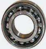
Rodamientos de una hilera de bolas radiales.