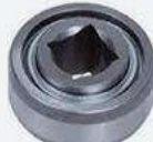
Rodamientos autocentrantes con interior cuadrado.