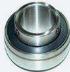
Rodamientos autocentrantes con prisionero.