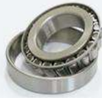
Rodamientos de una hilera de rodillos cónicos en pulgadas.