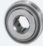
Rodamientos autocentrantes con interior hexagonal.