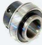
Rodamientos autocentrantes con virola de ajuste